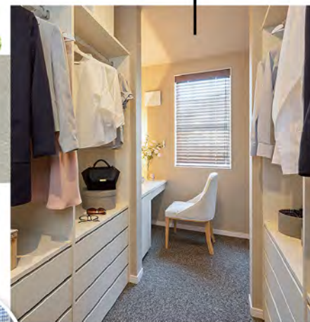
約4.5帖の広々W.I.C内には 奥様専用のミセスコーナー