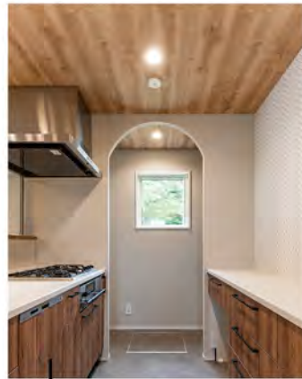
天井を下げて 木目クロス貼りにした キッチン