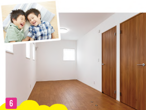
6 フレキシブルな子供室