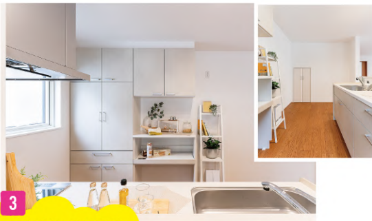
3 しっかりキッチン収納