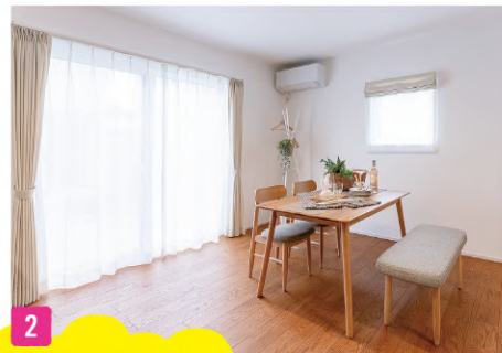
2 明るいダイニング