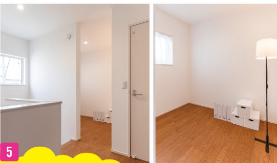
5 自由に使えるサービスルーム