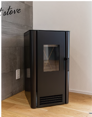
内覧会期間中は未設置となります。