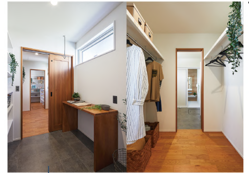
ファミリークローゼット&ランドリー