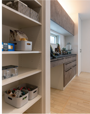
回遊できるキッチンとパントリー