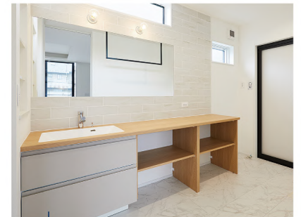
幅広の造作洗面化粧台