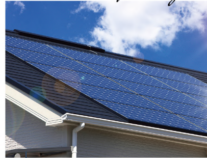
太陽光発電システム5.439kw搭載 +蓄電池