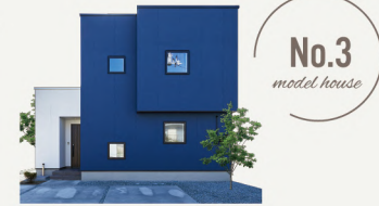
No.3 model house

3LDK ▶ 建物面積 98.27㎡(29.72坪) ▶ 土地面積 371.42㎡(112.35坪) (通路面積72.97㎡含む)