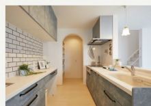
ウォークスルーのパントリー