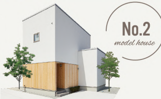
No.2 model house

3LDK ▶ 建物面積 99.77㎡(30.18坪) ▶ 土地面積 311.34㎡(94.18坪)