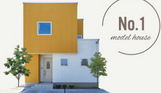
No.1 model house