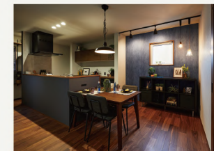
キッチン横のダイニング