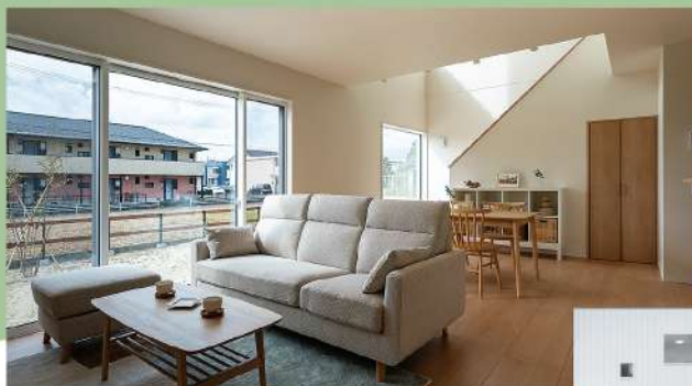
No.1 ゆったり落ち着くナチュラルstyle