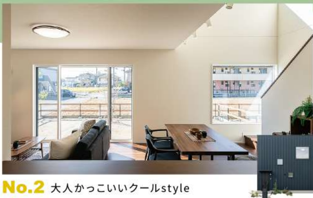
No.2 大人かっこいいクールstyle

■所在地/福島市瀬上町字桜町三丁目 ■総区画数/4区画 ■用途地域/第一種低層住居専用地域 ■構造/木造二階建 ■建物完成/2024年9月 ■道路/市道北8.20m、市道東6.0m ■設備/公営水道、公共下水、東北電力 ■交通/(阿武隈急行)瀬上駅徒歩6分 ■取引態様/土地:代理、建物:売主 ※別途、諸経費がかかります。※掲載内容に変更が生じる場合がございます。万が一ご成約済の場合はご容赦ください。 ■有効期限/令和6年11月末日