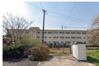
笹谷小学校 徒歩12分