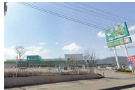
ハシドラッグ信陵店 徒歩9分

■所在地/福島市笹谷字上道場外■販売区画数/4区画■道路/公道 北南西6m、東9m■販売価格/849.66万円~1,090.8万円■土地面積/200.36㎡~200.83㎡■開発許可番号/開発許可番号福島市指令開第70号■取引態様/販売代理・建築条件付(売主:株日成不動産・山形県知事(13)第873号)■建築条件付とは、土地売買契約締結後、3ヶ月以内に当社と建築請負契約が成立することを条件として販売いたします。この期間内に建築請負契約が成立しなかった場合は、土地売買契約は白紙となり、お預かりした金額は全額無利息でお返しいたします。