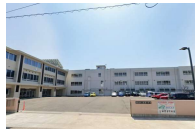
信陵中学校 徒歩8分