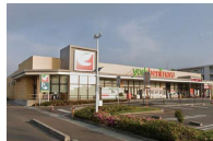
ヨークベニマル笹谷店 徒歩6分